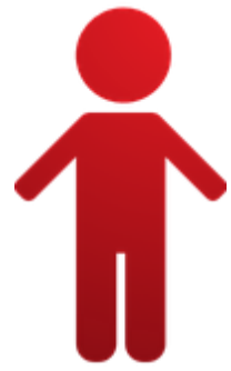
Schaubild 2; zur Ersten Eindämmungsverordnung des Landkreises Anhalt-Bitterfeld -Wer ist eine Kontaktperson-

Kontaktperson I - zu einer getesteten Person (durch PCR-Test oder durch ein Labor bestätigt) Quarantäne