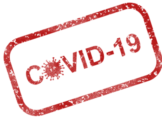
Schaubild 1; zur Ersten Eindämmungsverordnung des Landkreises Anhalt-Bitterfeld Corona Positiv – Was nun?