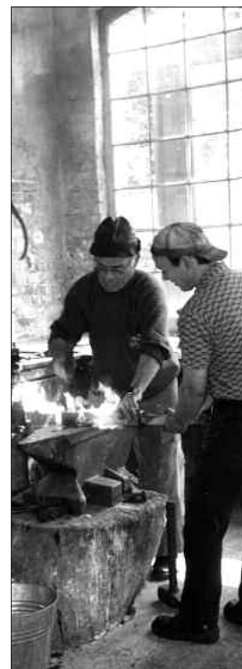
Meister Kührt bei der Arbeit in der Schmiede