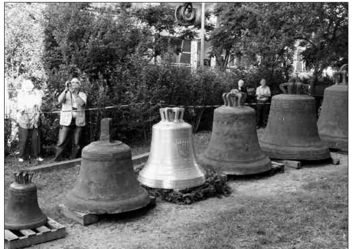
Die Glocken des Geläuts von St. Nikolai

Von 9:30 Uhr bis 17:00 Uhr können Besucher die Kirche mit ihren beiden Türmen besichtigen. Aber auch das wiederhergestellte Geläut ist zugänglich und wird von 9:50 Uhr bis 10:00 Uhr und von 15:00 Uhr bis 15:10 Uhr komplett erklingen. Die Mitglieder des Förderkreises St. Nikolai geben gern Auskunft und übernehmen wenn gewünscht auch Führungen.