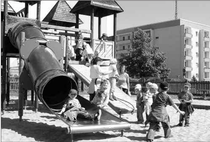
Die Knirpse der Kita Heide beim Toben auf dem Spielplatz Schleibank.

Herzlichen Glückwunsch allen Kindern zum Internationalen Kindertag am 1. Juni