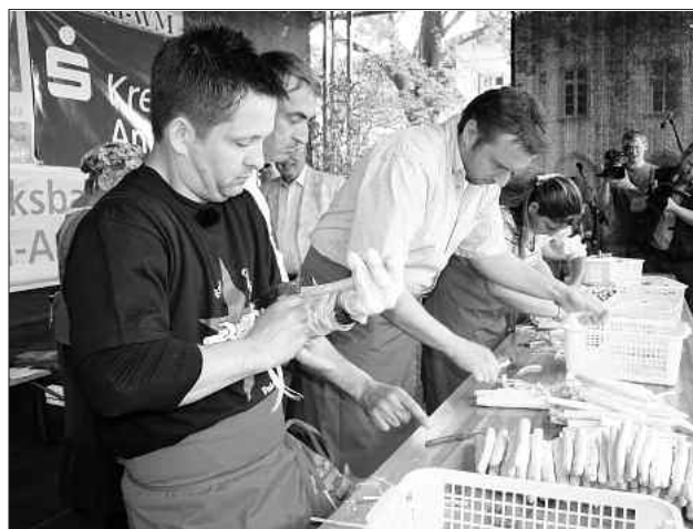
Vorne im Bild der alte und neue Weltmeister Bernhard Robben aus dem 400 Kilometer entfernten Leer.