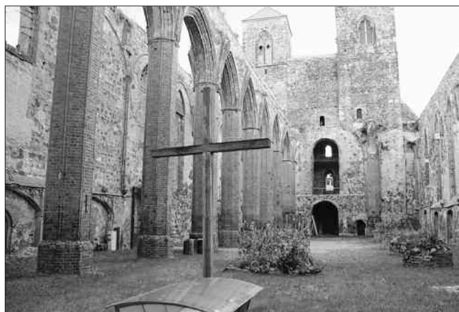
Blick in den Innenbereich der Nikolaikirche