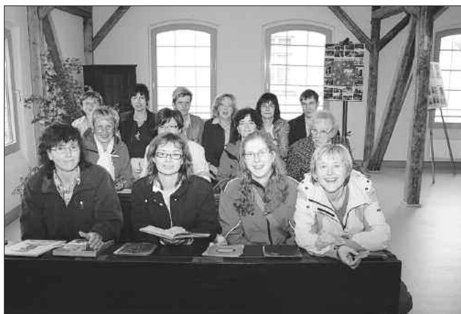
Die angehenden Gästeführerinnen bei der Besichtigung der kürzlich neu gestalteten Räumlichkeiten des Obergeschosses der Steutzer Schauschmiede