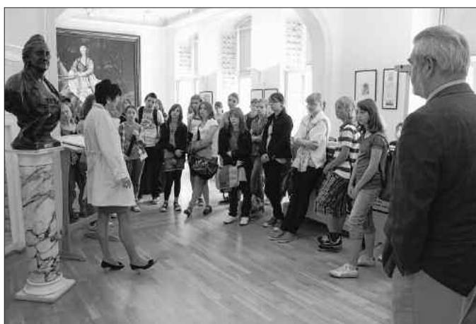
Die Schüler beider Partnerstädte bei der Besichtigung der Sammlung Katharina II auf der Schloßfreiheit.