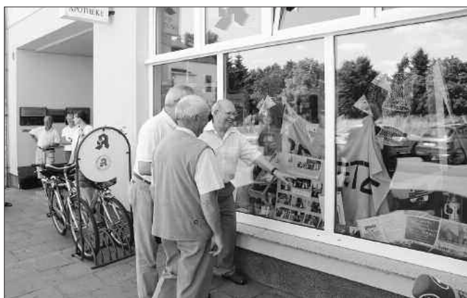
Noch bis zum 8. August ist die Schaufensterausstellung in der Fritz-Brandt-Straße zu besichtigen

Die Städtepartnerstadt zu Jever wird durch die Tätigkeiten vieler Einzelpersonen und vor allem durch das Wirken der ansässigen Vereine lebendig gehalten.