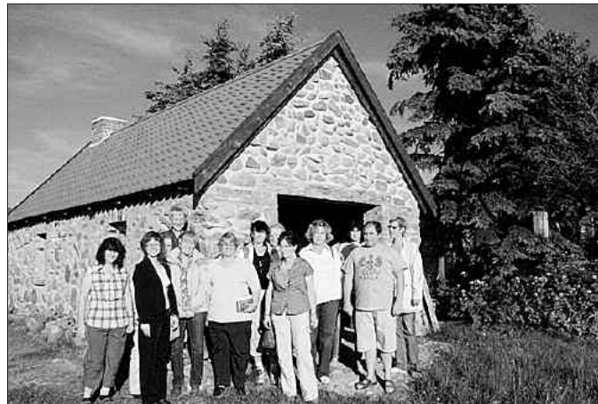
Gruppenfoto der Gästeführerinnen in Reuden/Anhalt