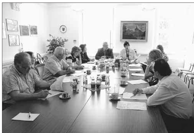
In Vorbereitung der 20. Gfa trafen sich die Hauptsponsoren und bewährten Partner in einer ersten Gesprächsrunde

In den nächsten Wochen wird über das Rahmenprogramm, die Einzelheiten zur Berufsfindungsmesse und viele organisatorische Details beraten.