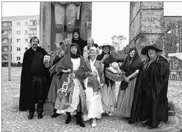
Alle Mitwirkende der Veranstaltung am 18. September 2010

Leiterin der Tourist-Information Zerbst/Anhalt