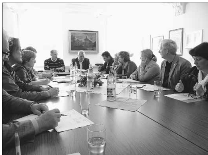
Die Vorbereitungsgruppe zu den Kulturfesttagen 2011 traf sich jüngst zur Zusammenstellung und Abstimmung der einzelnen Veranstaltungen und zum gegenseitigen Ideenaustausch

In jedem Fall, so sind sich alle Mitwirkenden jetzt schon einig, wird den Besuchern und Gästen wieder ein anspruchsvolles und vielfältiges Programm geboten werden, hinter das sich alle Mitveranstalter gemeinsam stellen können.