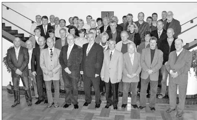
Gruppenfoto der anwesenden Stadtratsmitglieder der 15. Stadtratssitzung am 27.09.2010

Alle neuen Stadträte wurden zu Beginn der Sitzung auf die gewissenhafte Erfüllung ihres Ehrenamtes vereidigt und nahmen dann ihre ehrenamtliche Tätigkeit als Stadtrat wahr.