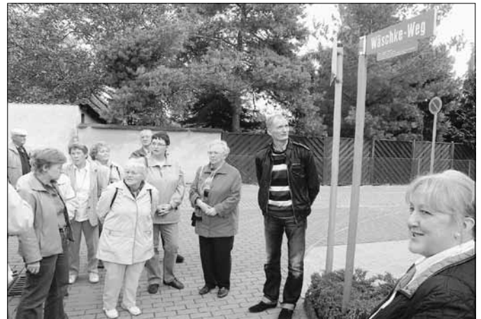
Der Zerbster Heimatverein e. V. macht mit einem Zusatzschild zur Straßenbezeichnung auf den verdienten Zerbster Ehrenbürger aufmerksam.