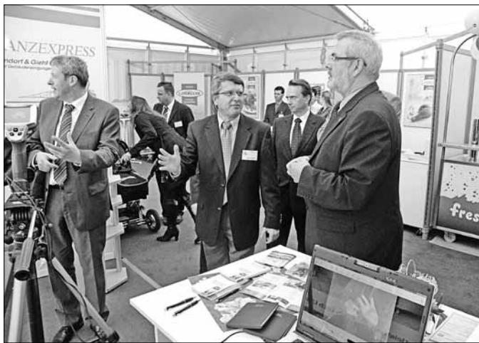
Die Jubiläums-Gfa 2010 bot fachliche Beratung und Informationen über den Stand der regionalen Wirtschaft

Unter Beteiligung von mehr als 100 Unternehmen als Haupt- und weiteren 15 als Unterausstellern war der Zerbster Schlossgarten einmal mehr ein gut und interessant bestücktes Messeterrain und ein besonderer Anziehungspunkt.