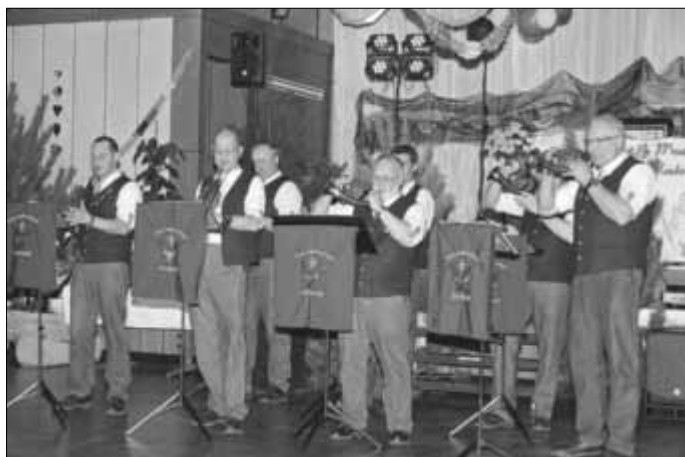
Die „Heide Jagdhornbläser Burgstall“ gestalten auch in diesem Jahr den Hubertusgottesdienst mit.

Nach dem Gottesdienst werden die Gäste in die Sommerkirche mit ihrem reizvollen Abendambiente zu einem gemütlichen Ausklang der Veranstaltung mit zünftiger Versorgung und jagdlicher Musik eingeladen.