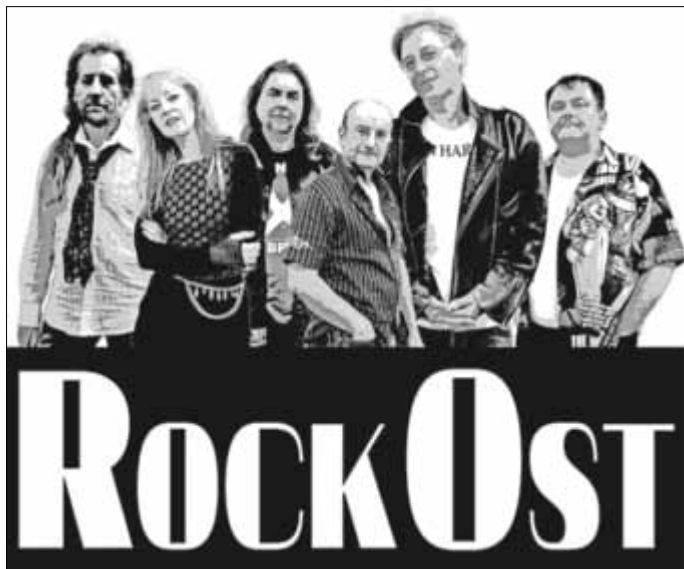
„Rock Ost“ macht am 7. November in der Zerbster Stadthalle Station.

Sechs Musiker aus den legendären Bands Silly, Stern Combo Meißen, Veronika Fischer und Band, Horst Krüger Band, Bajazzo, Modern Soul und Die Zöllner haben sich zusammen getan und spielen ihre Hits und Klassiker, der schönsten und beliebtesten Songs der DDR-Rockmusik, aus den 70er und 80er Jahren.