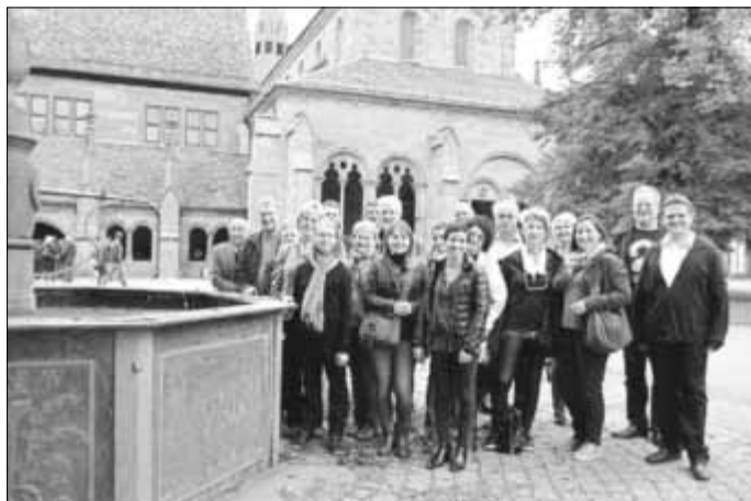
Vertreter seiner Partnerstädte Zerbst/Anhalt und Oullins hatte Nürtingen zum viertägigen Besuch eingeladen.

Vorbereitet war für die vier Tage ein vor allem kulturtouristisches Programm zum näheren Kennenlernen der Stadt Nürtingen und ihrer Umgebung. Daneben war Gelegenheit zum vielseitigen, auch länderübergreifenden Austausch. Ein Thema waren mögliche weitere Impulse für die städtepartnerschaftlichen Beziehungen.