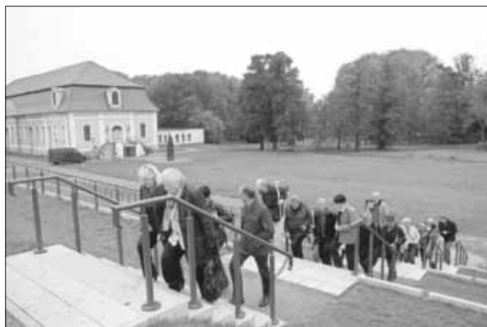
42 Teilnehmer machten sich beim 8. Anhaltischen Gästetreffen mit der Stadt Zerbst/Anhalt vertraut.

Fasch-Saal der Stadthalle und der Führungen am Nachmittag standen die Stadt selber, das Schloss sowie die Themen Katharina II., Luther und Cranach.