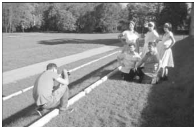
Fototermin an der Tribüne im Schlossgarten. Sie steht im Mittelpunkt der 37. CCZ-Session.