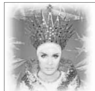
Die Geschichte der Schneekönigin ist in einer Musicalfassung in der Zerbster Stadthalle zu erleben.

Karten sind in der Zerbster Tourist-Information erhältlich.