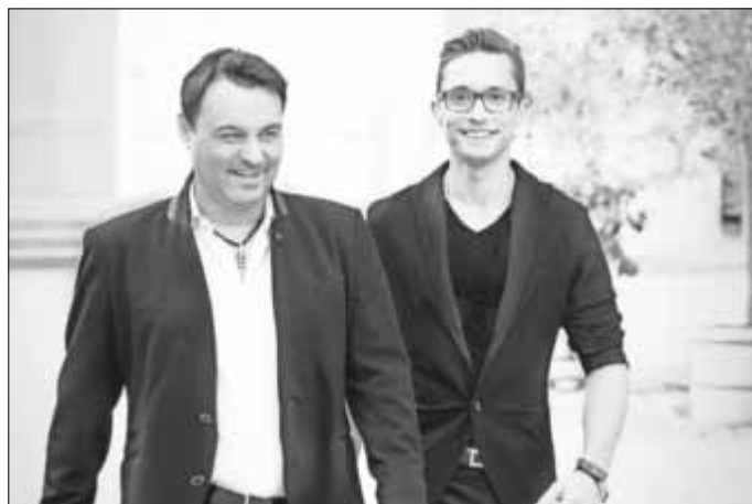
„Tenöre4you“ gastieren am 30. Januar 2015 in der Zerbster Stadthalle.

Karten gibt es in der Zerbster Tourist-Information.