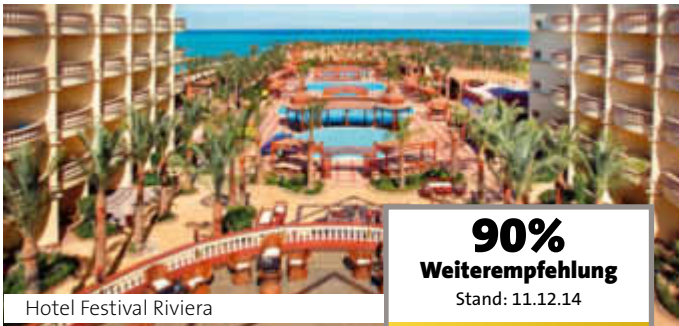
Hotel Festival Riviera