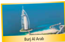
Burj Al Arab

Erleben Sie zwei Emirate der Superlative und tauchen Sie ein in die märchenhafte Welt von 1001 Nacht. Dubai und Abu Dhabi kombinieren auf eindrucksvolle Weise Tradition und moderne Weltwunder. Entdecken Sie imposante Sehenswürdigkeiten wie das Burj Al Arab und den Burj Khalifa .