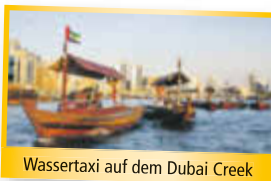
Wassertaxi auf dem Dubai Creek