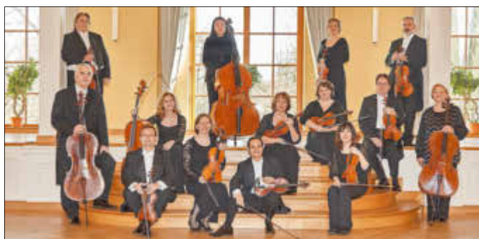
Die Mitteldeutsche Kammerphilharmonie Schönebeck gestaltet am 17. September zum 10. Mal die „Serenade im Schloss“.

Karten für das Konzert gibt es in der Zerbster Tourist-Information sowie im Otto-Shop.