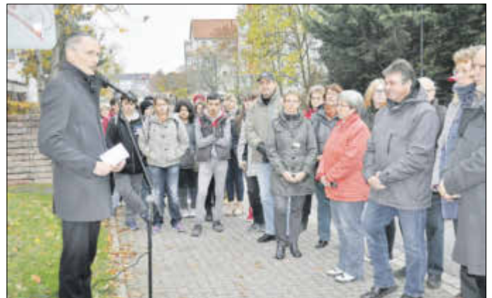
Am ehemaligen Standort der Synagoge gedenken die Zerbster der vertriebenen und ermordeten Mitglieder der jüdischen Gemeinde.