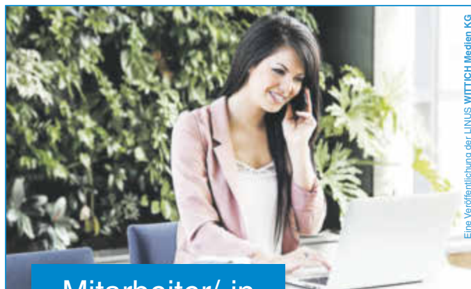
Eine Veröffentlichung der LINUS WITTICH Medien KG

Lokal informiert. Druck. Internet. Mobil.