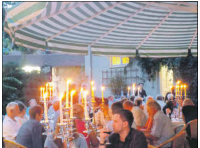
Zum 4. Russischen Abend (hier ein Bild von der 3. Auflage) lädt der Internationale Förderverein „Katharina II.“ am 17. August ein.