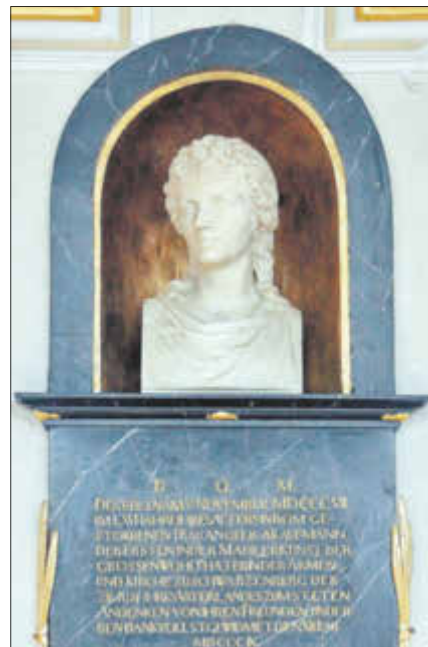
Der Malerin Angelika Kauffmann ist die nächste Veranstaltung der Anhaltischen Goethe-Gesellschaft gewidmet.