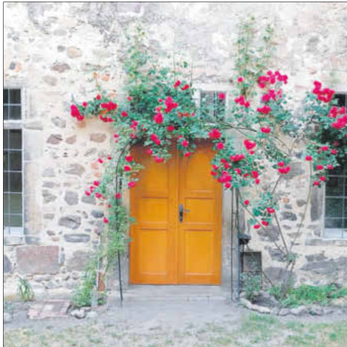
Einen stimmungsvollen Abend verspricht die 16. Zerbster Museumsnacht.

„Rainer Gräßler and the perfect gents“ mit „Rock und Pop der frühen Jahre“ sowie das Gitarren-Duo Claudia Bruchmüller und Rainer Gräßler gestalten den musikalischen Part des Abends. Eine gastronomische Versorgung wird ebenfalls angeboten. Karten zum Preis von 15 Euro sind in der Tourist-Information sowie im Museum erhältlich.