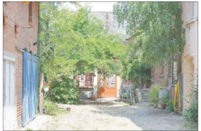
Verschiedene Orte der Zerbster Essenzen-Fabrik können Teilnehmer der „Taglichtöffnungen“ entdecken.

Eine weitere Aufführung ist für Freitag, den 7. September, um 18 Uhr geplant. Sie leitet dann das Veranstaltungswochenende rund um den Tag des offenen Denkmals in der Essenzen-Fabrik ein.