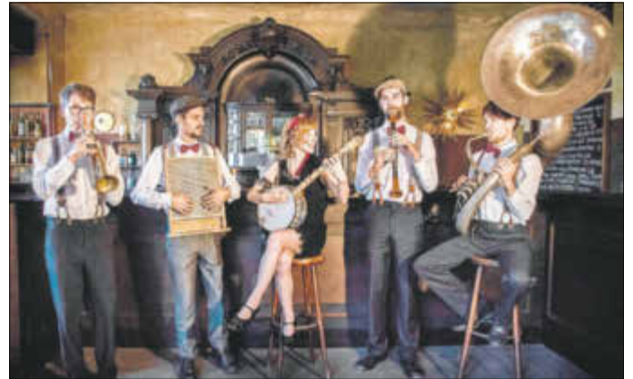
Das bundesweit bekannte Rufus Temple Orchestra spielt zur 20er Jahre-Party in der Essenzen-Fabrik auf.

„Fit in Form“ (Breite 70, Tel. 015162816938) oder unter info@essenzen-fabrik.de sowie an der Abendkasse für 20 Euro.