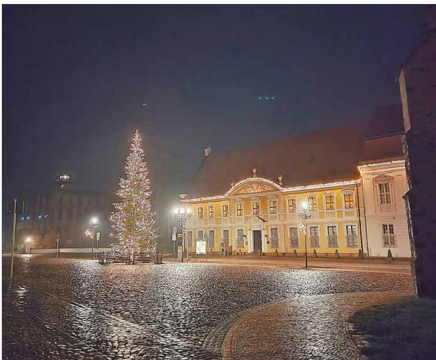
Rathaus Stadt Zerbst/Anhalt 2025

Eine besinnliche Weihnachtszeit und einen guten Rutsch in das neue Jahr 2026 wünscht allen Leserinnen und Lesern des Amtsboten die Stadt Zerbst/Anhalt.