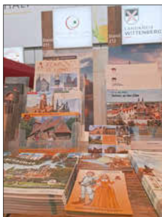
Mit vielfältigen Informationsmaterialien wurde für die Stadt und Region geworben.

Die Tourist-Information der Stadt Zerbst/Anhalt warb am Stand des Tourismusverbandes WelterbeRegion Anhalt-Dessau-Wittenberg e.V. mit unseren vielen Sehenswürdigkeiten und Kulturangeboten an drei verschiedenen Tagen persönlich vor Ort. Besonders gefragt waren Campingplätze, Angebote zum Radfahren, kulturelle Highlights und kulinarische Empfehlungen.