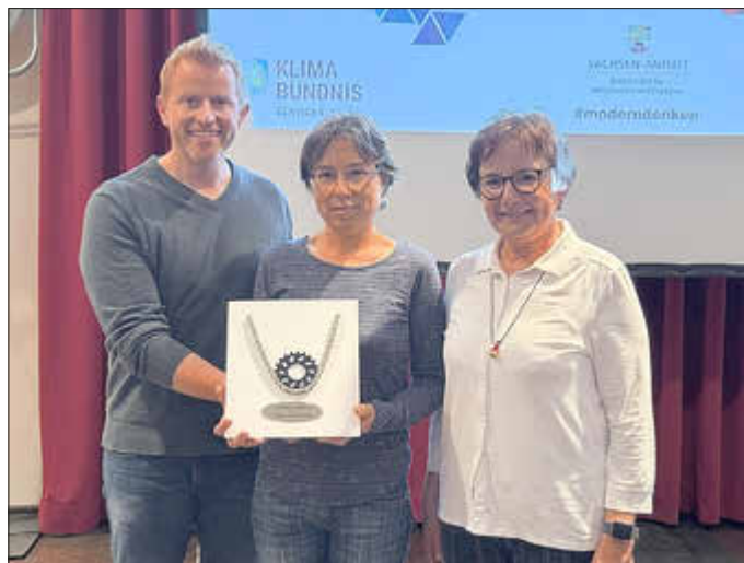
Vertreter der Radelgruppe der Stadtverwaltung

Mehr Informationen und alle Ergebnisse zur Kampagne STADTRADELN gibt es auf der Website stadtradeln.de.