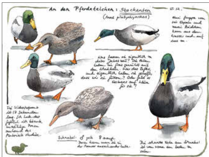
Nature Journaling - Zeichnung und Text von Antje Gilland

Wie immer starten die Festtage mit Ausstellungseröffnungen. Im Rathaus findet am 13. Februar 2026 um 16:00 Uhr die Vernissage zur Ausstellung „Nature Journaling – Naturwunder im Alltag“ von Antje Gilland statt. Die Aquarellkünstlerin beschäftigt sich in ihrer künstlerischen Arbeit tiefgehend mit den Tieren und Pflanzen in ihrer unmittelbaren Umgebung. Dabei verwendet sie die Methode des Nature Journaling, bei der kreative Betätigung mit einer intensiven Recherche verbunden wird. Dabei entstehen Mischungen aus Bild und Text; Naturliebe und Wissenserweiterung fließen zusammen.