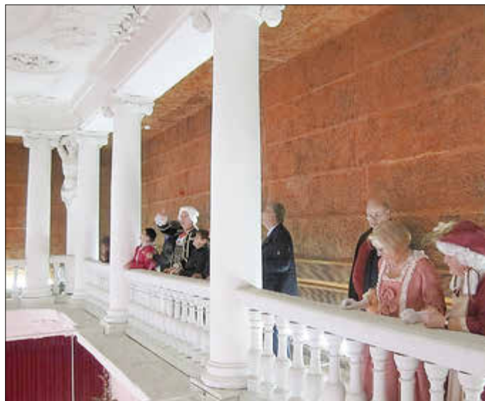
Kostümierte Vereinsmitglieder und Gäste auf der großen Empore der Stadthalle

In die über 290-jährige Geschichte der Zerbster Stadthalle können die Besucher am 28. Februar 2026 um 14:00 Uhr in der Stadthalle eintauchen. Ein kurzweiliger Bildervortrag „ Vom Reithaus zur Stadthalle “ führt in die Historie des Barockgebäudes ein. Anschließend werden die Besucher von historischen Persönlichkeiten durch die Stadthalle geführt. Es wird nicht nur ein baugeschichtlicher Abriss geboten, auch Einblicke in die barocke Lebensweise und Hofklatsch werden von den Vereinsmitgliedern in Barockgewändern vorgebracht. Der unterhaltsame Rundgang führt vom Katharina-Saal weiter in die Fürstenloge, zur Empore und den Dachboden der Stadthalle. Bei Kaffee und Kuchen können die Besucher anschließend den Nachmittag im Barockambiente ausklingen lassen. Das Programm ist unentgeltlich, der Förderverein Schloss Zerbst e.V. bittet um Spenden für die Weiterentwicklung des Zerbster Schlosses.