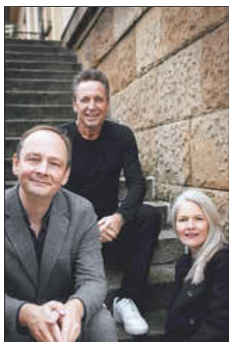
Das Trio „Songland“ ist im Eröffnungs-konzert zu erleben.