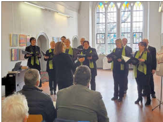
Der Kammerchor Zerbst lädt zum „Singen im Alumnatskorridor“ ein.

Der Kammerchor Zerbst wird am 1. März 2026 um 14:30 Uhr traditionell beim „Singen im Alumnatskorridor“ des altherwürdigen Francisceums die Ausstellung „Junge Kunst in Anhalt“ musikalisch umrahmen. Vor und nach dem Konzert können die Kunstwerke von jungen Leuten aus unterschiedlichen Regionen Anhalts betrachtet werden. Schülerinnen und Schüler des Gymnasiums übernehmen die Versorgung mit Kaffee und Kuchen. In gewohnter Weise bietet der Kammerchor einen musikalischen Querschnitt seines Repertoires, von alten Madrigalen über Volkslieder und Lieder alter Meister bis zu Scherzliedern und Popsongs. Auch zum Mitsingen wird Gelegenheit sein. Der Kammerchor Zerbst freut sich auf einen schönen Nachmittag mit bildender Kunst, Musik und gemütlicher Kaffeerunde.