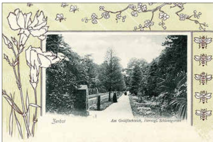
Corthums-Weg mit Goldfischteich (links) und Palmen (rechts) zu herzoglichen Zeiten

Der Förderverein Schloss Zerbst e.V. widmet seinen diesjährigen Multimediovortrag am 27. Februar 2026 um 19:00 Uhr im Fasch-Saal der Stadthalle folgendem Thema: „ Der barocke Schlossgarten und seine Gebäude “. Der Zerbster Schlossgarten bildete zunächst den Rahmen für die Burg, später für das Barockschloss. Das heutige Areal, das immer wieder Veränderungen unterzogen wurde, blickt auf ein Bestehen von mehreren hundert Jahren zurück. Referent Dirk Herrmann geht auf die acht separaten Gärten des Schlossbezirkes ein. Außerdem stellt er die acht repräsentativen, von der fürstlichen Familie genutzten Gebäude und 16 funktionale, für die Bewirtschaftung des Hofes ausgelegte Häuser vor. Zahlreiche Bilder entführen in die Glanzzeit des fürstlichen Hofes zu Anhalt-Zerbst.