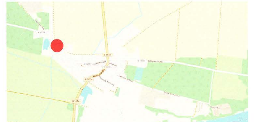
Karte hergestellt aus OpenStreetMap-Daten | Lizenz: Open Database License (ODbL)