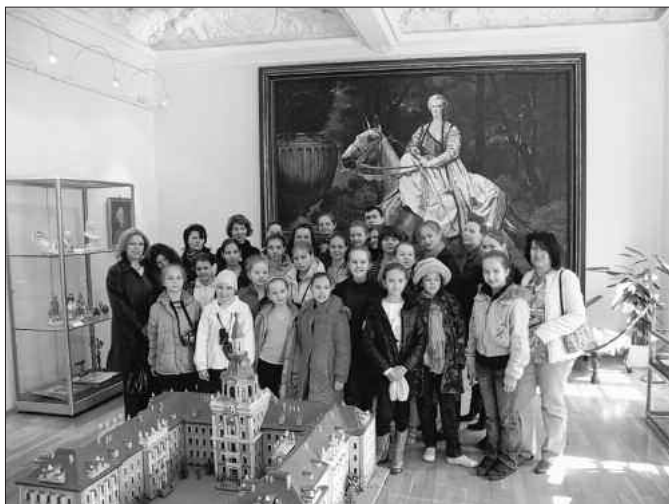
Gruppenfoto der königlich-russischen Ballettschule aus Puschkin/St. Petersburg in der Sammlung Katharina II.