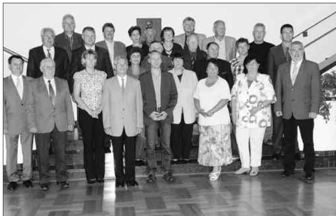
Der Bürgermeister der Städte und Gemeinden nach Unterzeichnung der Gebietsänderungsverträge

Der heutige 03. Juni 2009 ist ein historischer Tag, dem wir alle verpflichtet sind.