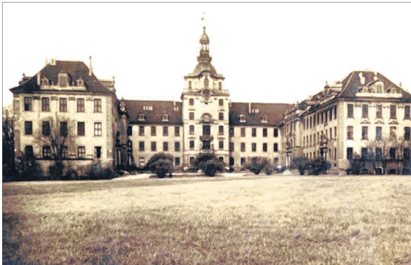
Schloss Zerbst vor der Zerstörung am 16. April 1945

- Karten in der Touristinformation der Stadt erhältlich -