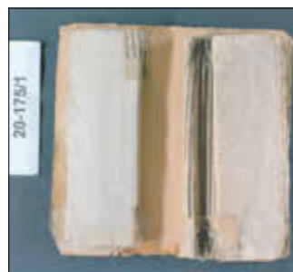
Fördermittel machten die Restaurierung historischer Zerbster Stadthandbücher möglich, hier ein Vorher-Nachher-Vergleich.

die Stadthandbücher, über Einnahmen und Ausgaben der Stadt, konnten somit wieder benutzbar gemacht werden. Aufgrund der erheblichen Kriegsverluste am historischen Bestand des Zerbster Stadtarchivs ist die Stadt Zerbst/Anhalt mit dem Stadtarchiv fortwährend bestrebt, die bestehenden Archivalien zu sichern und zu erhalten. Besonderer Dank gilt