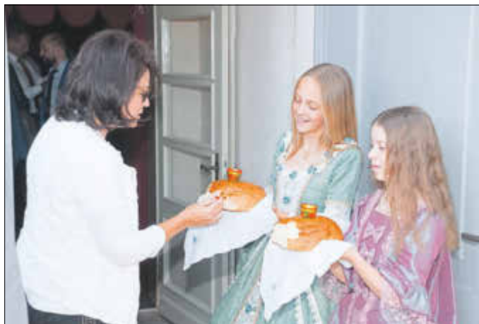
Mit Brot und Salz werden die Teilnehmer des Katharina-Forums von den jungen Zerbster Prinzessinnen begrüßt. In diesem Jahr soll der deutsch-russische Wirtschafts- und Wissenschaftsdialog des Landes Sachsen-Anhalt zum dritten Mal in Zerbst/Anhalt stattfinden.

Die kaiserliche Großmutter setzte alle Erwartungen in ihre Enkel, die sie nach ihren Vorstellungen zu erziehen gedachte. So wie Elisabeth, nahm auch sie die erstgeborenen Enkel in ihre Obhut. Sie verfasste Erziehungsgrundsätze sehr modernen Zuschnitts, angefangen bei der Säuglingspflege bis zur geistigen Ausbildung. Sie brachte den Knaben Alexander und Konstantin das ABC bei, spielte mit ihnen und schrieb für sie Märchen, Fabeln, verfasste Grundlehren des bürgerlichen Unterrichts. Mit praktischem Sinn entwarf