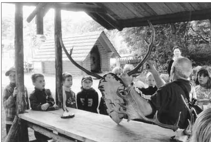
Ein lehrreicher Tag für die Zweitklässler der GS „An der Stadtmauer“ im Jugendwaldheim.

Wie stark ein Orkan und auch eine Baumwurzel sein kann, erfuhren sie an der Baumwurzel aus Dobritz, die Kyrill aus dem Boden riss. Mit selbst gesammelten Zapfen versuchte sich jeder beim Zapfenzielwurf. Frische Waldluft und die Bewegung sorgten zwischenzeitlich für Hunger. Der konnte jetzt im Waldheim bei einer kräftigen Portion Nudeln gestillt werden. Da es noch Zeit war, bis der Bus kam, konnten die Kinder sich noch einmal beim Kegeln, Fußballspielen oder Schaukeln austoben. Vor Abfahrt wurde jedem Teilnehmer eine kleine Medaille aus Holz überreicht. Ein besonderer Dank gilt dem Team des Walderlebnispfad Spitzberg, die die Führung mit viel Liebe, Geduld und Sachkenntnis gestalteten. Auf der Rückfahrt herrschte im Bus „Waldesruh“, denn so viel Erlebtes und frische Luft machen müde.