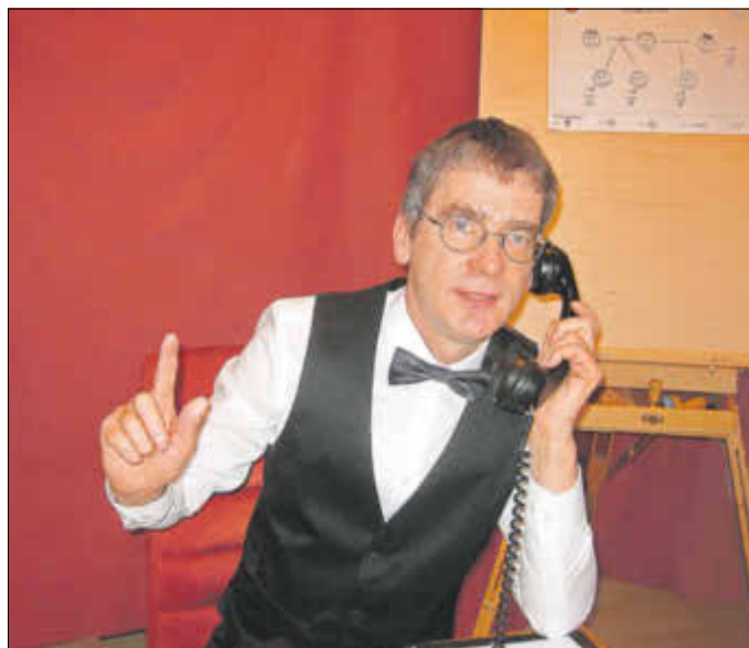
Mit seiner heiteren Rechtsberatung ist Kabarettist Lutz Teetzen zu Gast in der Zerbster Stadthalle.

Versprochen wird amüsante Kleinkunst zum Mitdenken - mit den Mitteln des Schauspiels, des Films und des Dialogs. Es gibt eine Mischung von juristischen Inhalten und komödiantischer Darbietung. Die Karten - vielleicht ein schönes Weihnachtsgeschenk - sind zum Preis von 13 Euro zzgl. VK im Vorverkauf in der Tourist-Information Zerbst, Markt 11, Tel. 03923 2351, sowie für 15 € an der Abendkasse erhältlich. Sollte die Veranstaltung wegen der Corona-Pandemie verschoben oder abgesagt werden, behalten die Karten ihre Gültigkeit oder werden anstandslos gegen die Erstattung des Kaufpreises zurückgenommen.