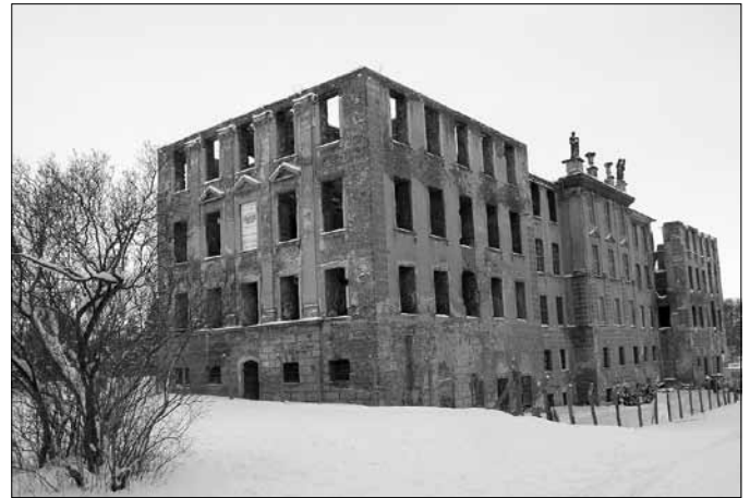
Blick auf den Ostflügel des Schlosses im Winter 2010

Die Mitglieder des Fördervereins wünschen besinnliche Weihnachtsfeiertage und freuen sich auf Ihren Besuch im neuen Jahr 2012.